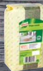
Knorr Majoránka 0,25 kg