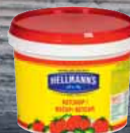
Hellmann's kečjap 5 kg