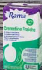
Rama Cremefine Fraiche 1 l