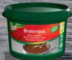
Knorr Bratenjus Štáva k pečení 3,5 kg