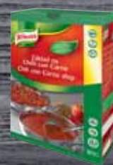
Knorr Základ na Chilli con Carne 2 kg