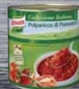
Knorr Polparicca di Pomodoro 2,55 kg