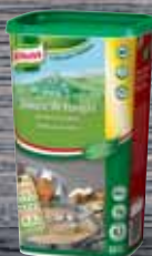
Knorr Žampionovo- hříbková omáčka 1 kg