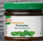
Knorr Professional Primerba bazalka 340 g