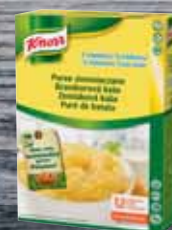
Knorr Bramborová kaše s mlékem 4 kg