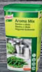
Knorr AromaMix Slanina & Cibule 1,2 kg