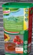
Knorr Základ na boloňskou omáčkou 1 kg