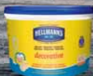
Hellmann's Decorative majonéza 3 l