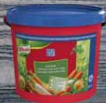
Knorr Delikát 5 kg