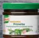
Knorr Professional Primerba Provensálské koření 340g