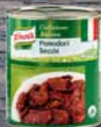
Knorr Sušená rajčata v oleji 0,75 kg