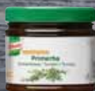
Knorr Professional Primerba Tymián 340 g