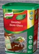
Knorr Demi glace 1,1 kg