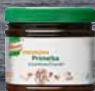
Knorr Professional Primerba česnek 340 g