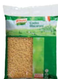
Knorr Těstoviny Codini - Kolínka 3 kg