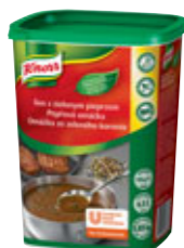
Knorr Peřová omáčka 0,85 kg