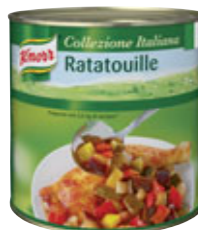
Knorr Ratatouille 2,5 kg