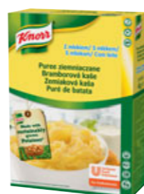
Knorr Bramborová kaše s mlékem 4 kg