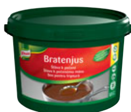
Knorr Štáva k pečení - Bratenjus 3,5 kg