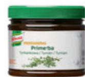
Knorr Professional Primerba Tymián 0,34 kg