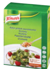
Knorr Krutony 0,7 kg