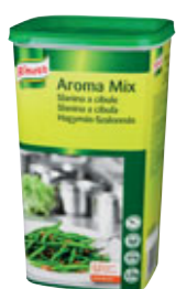
Knorr AromaMix Slanina & Cibule 1,2 kg