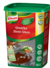
Knorr Demi Glace 1,1 kg