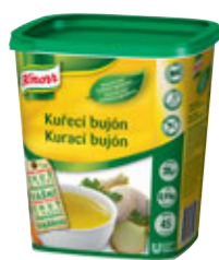
Knorr Kuřecí bujón 0,9 kg