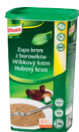
Knorr Hříbkový krém 1,3 kg