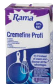
Rama Cremefine Profi Na vaření 1 l