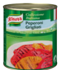
Knorr Peperoni Grigliati - grilovaná paprika 0,75 kg