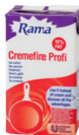
Rama Cremefine Profi Ke šlehání 1 l