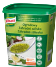
Knorr Zahradní zálivka 0,7 kg