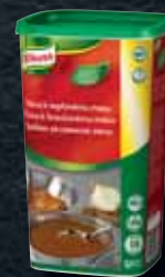
Knorr Štáva k vepřovému masu 1,4 kg