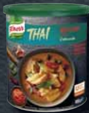
Knorr Červená kari pasta