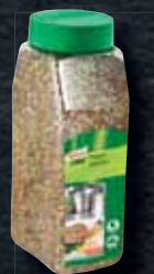
Knorr Pepř barevný drcený 0,5 kg