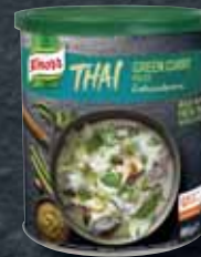
Knorr Zelená kari pasta