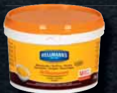
Hellmann's Hořčice 3 kg