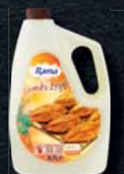
Rama Combi Profi 3,7 l