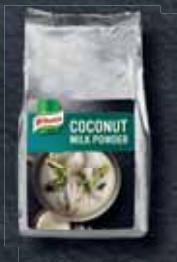
Knorr Sušený kokosový krém