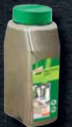
Knorr Pepř černý mletý 0,5 kg