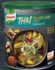
Knorr Žlutá kari pasta